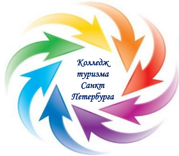
Профессионально-общественная аккредитация двух основных профессиональных образовательных программ