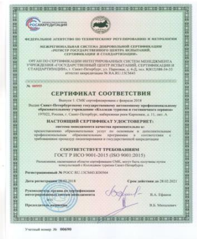
Система менеджмента качества до 2021 года